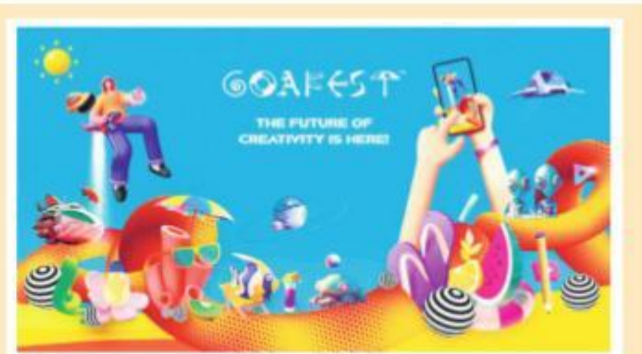
The creatives for this year's event, like the one above, have been generated by AI